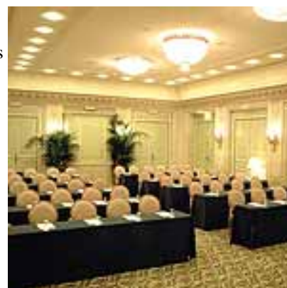
Tableau de capacité

L'hôtel comprend trois prestigieux salons au rez-de-chaussée, dont le salon Pompadour. Deux salles de conférence adjacentes sont disponibles pour les soirées diplomatiques, les défilés de mode, les repas et les soirées. Ces salles peuvent recevoir de 20 à 400 personnes.